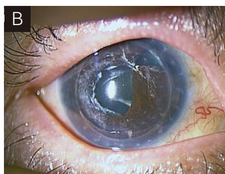
【図】 全層角膜移植後の拒絶反応の一例